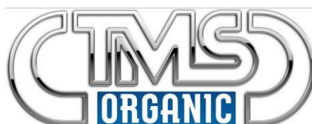
Sl. 1. Znak sertifikacije organske proizvodnje (dozvoljena je upotreba i crno – bele verzije znaka u kojoj se umesto plave pozadine koristi crna)

Znak sertifikacije i nacionalni znak „organski proizvod ne sme da bude izmenjen, ni u formi ni u boji. Ne sme da bude dodatnog pisanja unutar oznaka. Minimalna veličina prečnika kruga oznake sa slike br.2 je 20 mm, a u slučaju izuzetno malih pakovanja velčina prečnika kruga se može smanjiti na 9 mm. Izuzetno, u slučaju kada postoje razlozi koji onemogućavaju da se organski proizvod obeleži nacionalnim znakom u boji, može se obeležiti oznakom za sertifikovani organski proizvod koja je crno – bele boje na crnoj odnosno beloj podlozi.